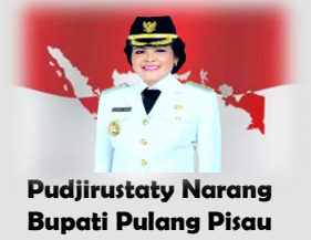
Pujirustaty Narang Bupati Pulang Pisau