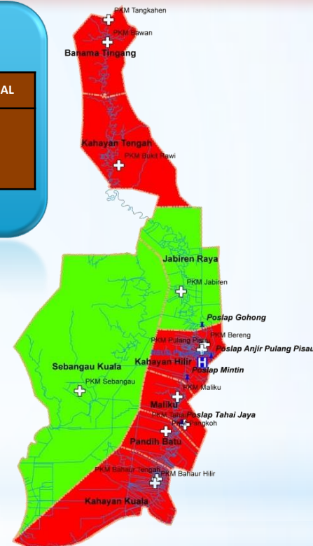
Data Zona Peta Sebaran Kasus Covid – 19 Kabupaten Pulang Pisau Dari Tanggal 17 Maret s/d 28 Juni 2020