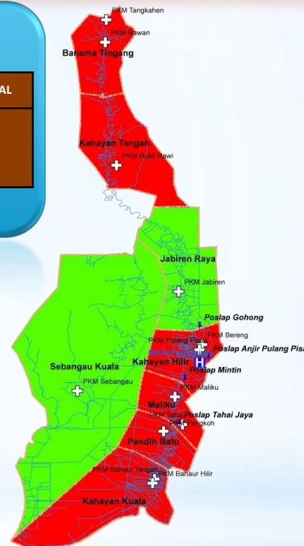
Data Zona Peta Sebaran Kasus Covid – 19 Kabupaten Pulang Pisau Dari Tanggal 17 Maret s/d 26 Juni 2020