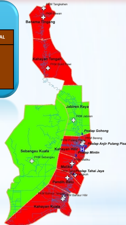
Data Zona Peta Sebaran Kasus Covid – 19 Kabupaten Pulang Pisau Dari Tanggal 17 Maret s/d 23 Juni 2020