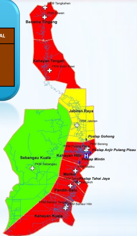
Data Zona Peta Sebaran Kasus Covid – 19 Kabupaten Pulang Pisau Dari Tanggal 17 Maret s/d 11 Juni 2020