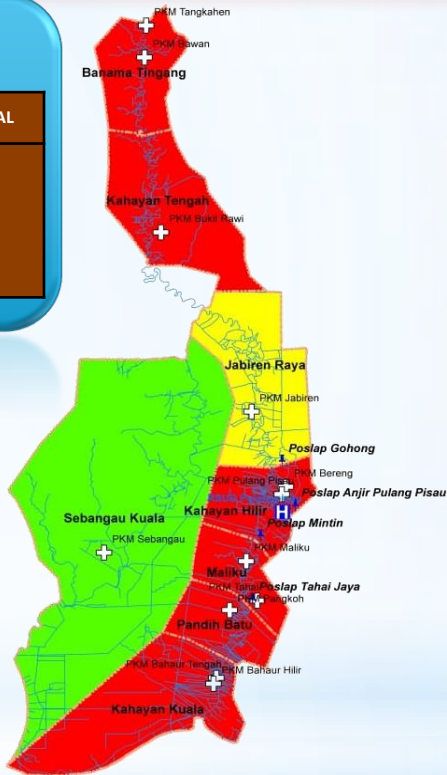
Data Zona Peta Sebaran Kasus Covid – 19 Kabupaten Pulang Pisau Dari Tanggal 17 Maret s/d 08 Juni 2020