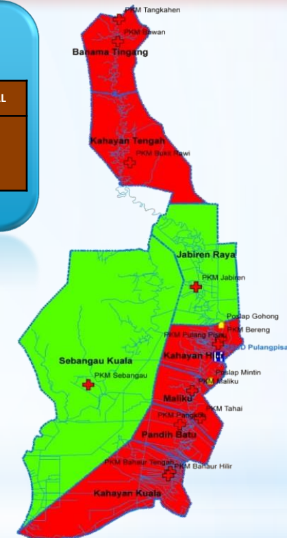
Data Zona Peta Sebaran Kasus Covid – 19 Kabupaten Pulang Pisau Dari Tanggal 17 Maret s/d 1 Juni 2020