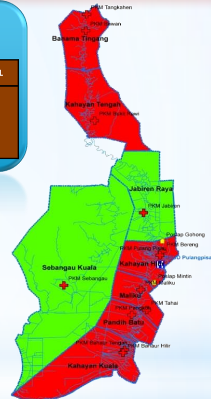
Data Zona Peta Sebaran Kasus Covid – 19 Kabupaten Pulang Pisau Dari Tanggal 17 Maret s/d 30 Mei 2020