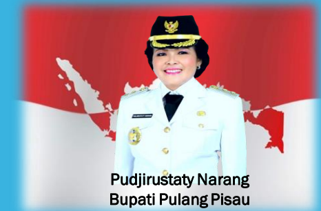
Pudjirustaty Narang Bupati Pulang Pisau