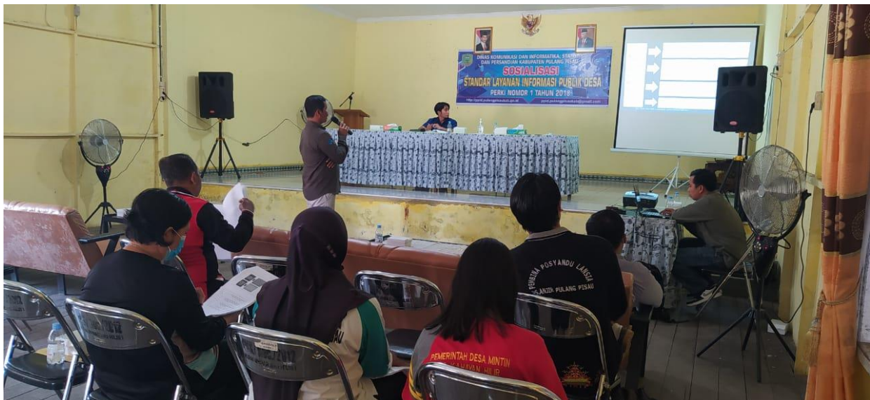
Sosialisasi Standar Layanan Informasi Publik Desa di Kecamatan Kahayan Hilir Tahun 2022