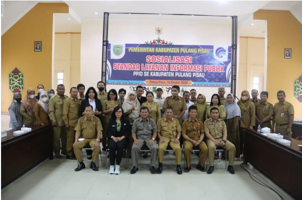
Sosialisasi Standar Layanan Informasi Publik PPID Se-Kabupaten Pulang Pisau Tahun 2022, dengan peserta PPID Pelaksana dan Ketua Organisasi Wartawan dan sebagai narasumber dari Komisi Informasi Provinsi Kalimantan Tengah.