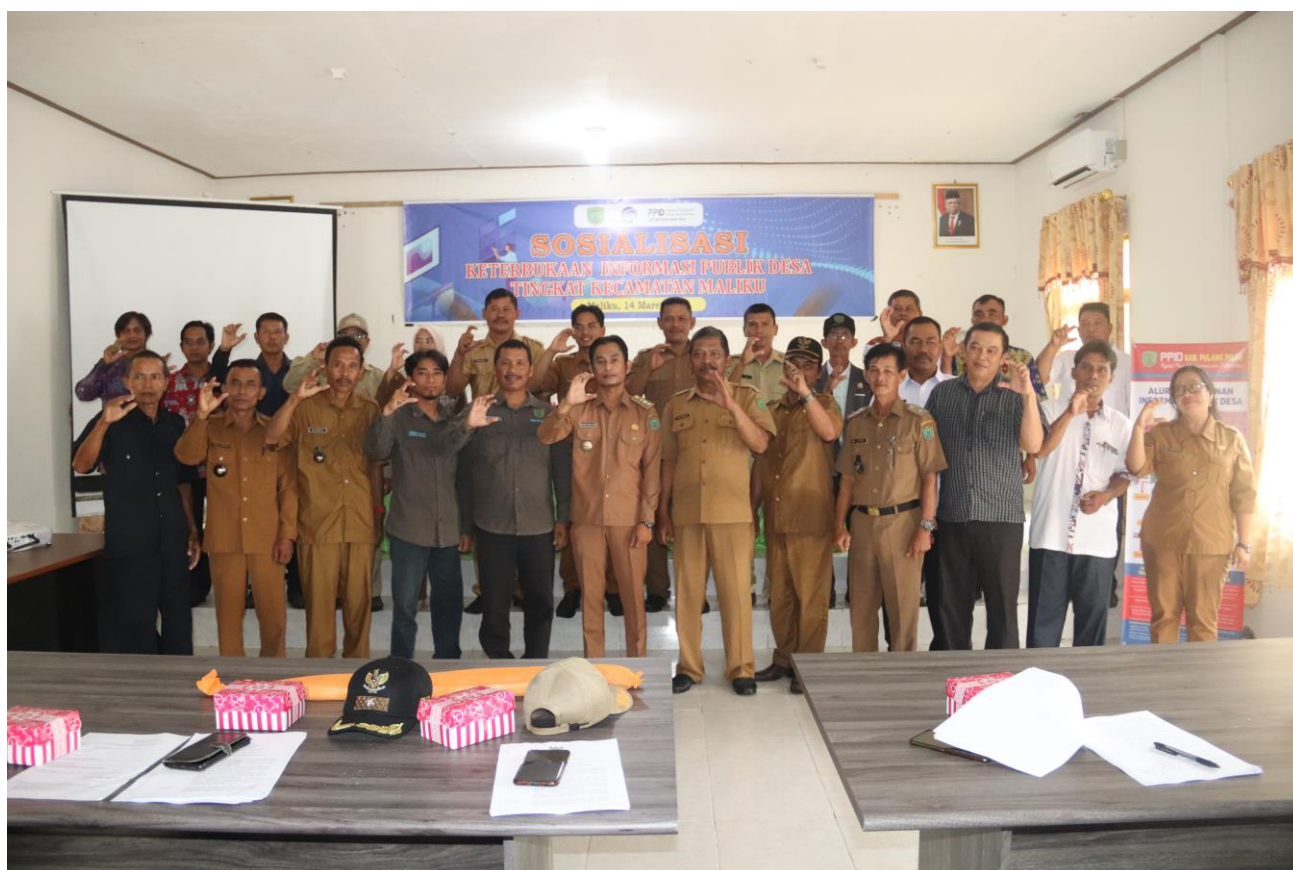
Sosialisasi Keterbukaan Informasi Publik Desa di Kecamatan Maluku Tahun 2023