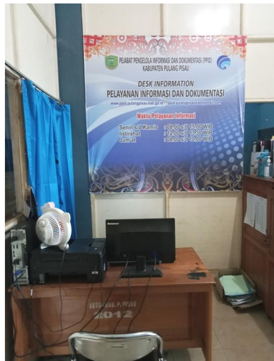
Desk Informasi Sarana dan Prasarana Pelayanan Informasi Publik PPID Utama Kabupaten Pulang Pisau