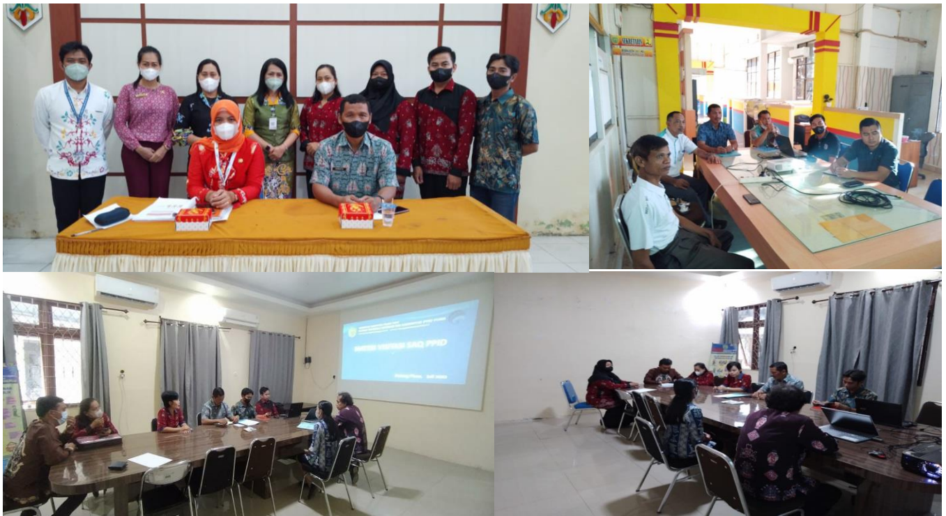
Kegiatan visitasi PPID Utama ke PPID Pelaksana Tahun 2022