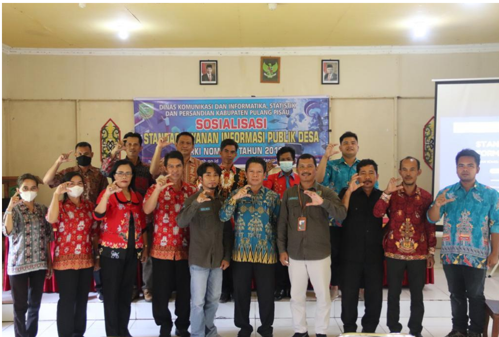
Sosialisasi Standar Layanan Informasi Publik Desa di Kecamatan Jabiren Raya Tahun 2022