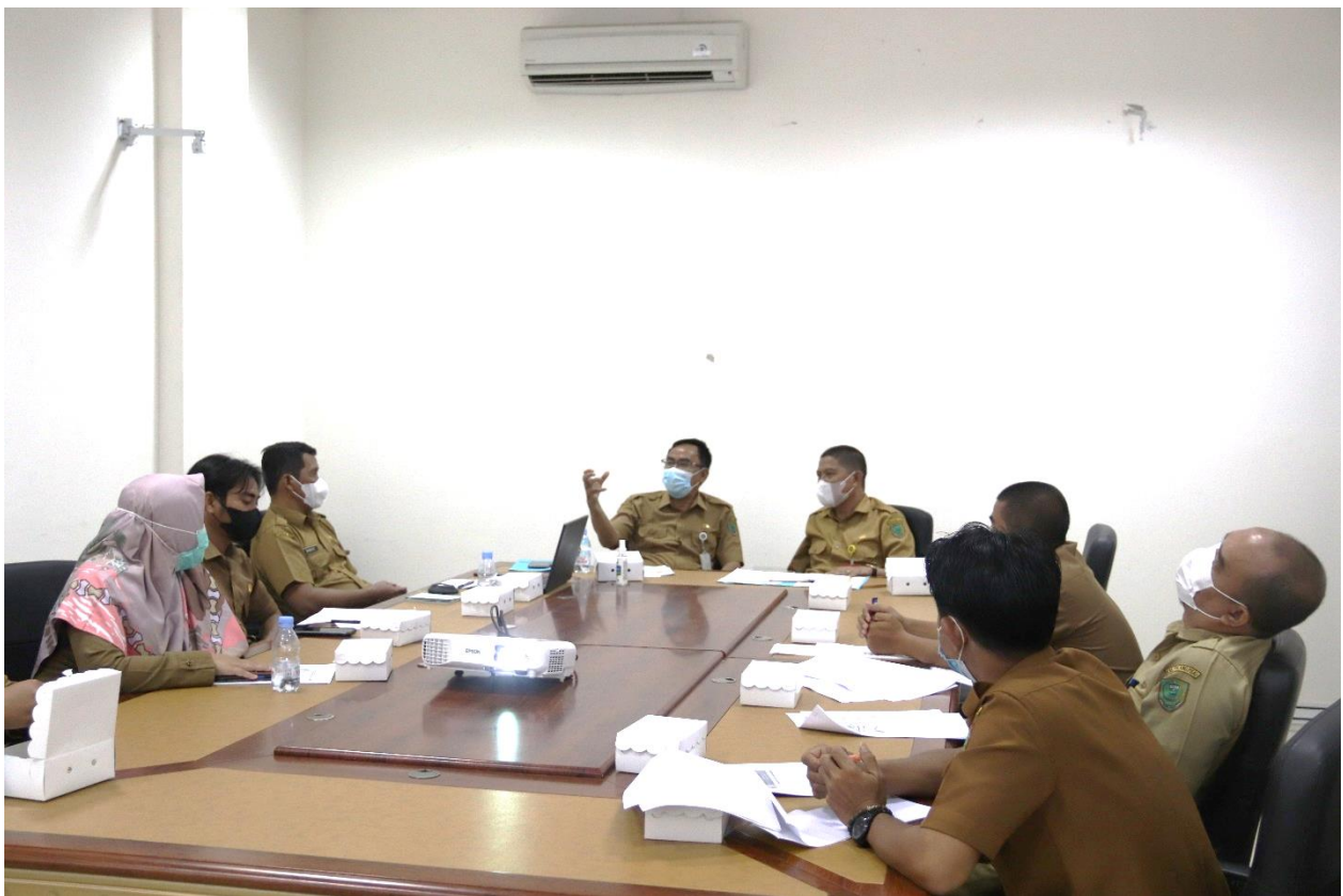
Rapat Koordinasi PPID Utama Kabupaten Pulang Pisau