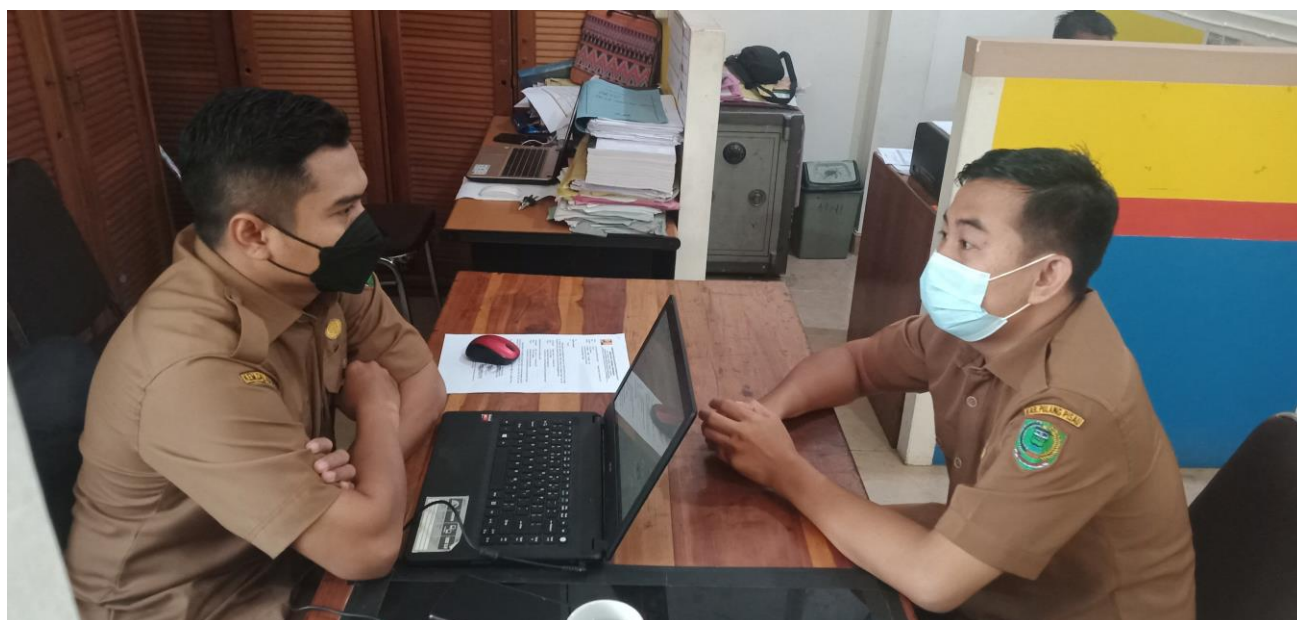
Kegiatan Visitasi ke beberapa Perangkat Daerah