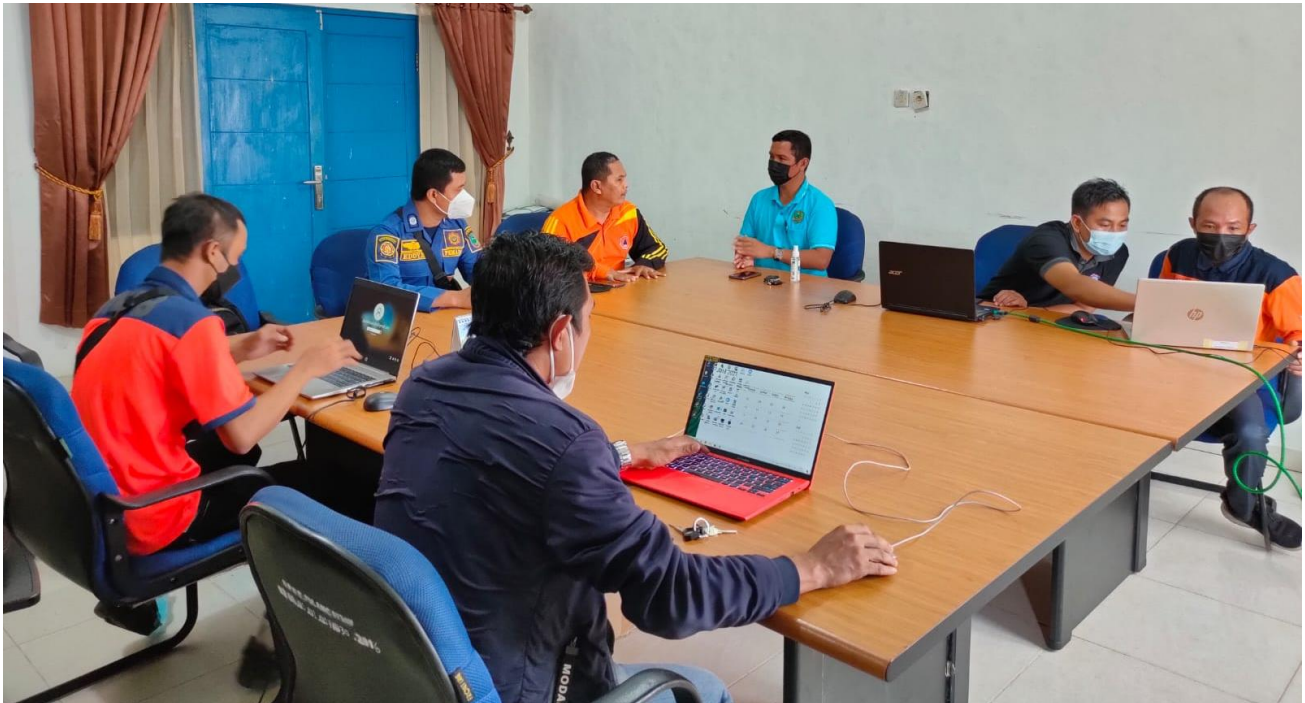
Kegiatan Visitasi ke beberapa Perangkat Daerah