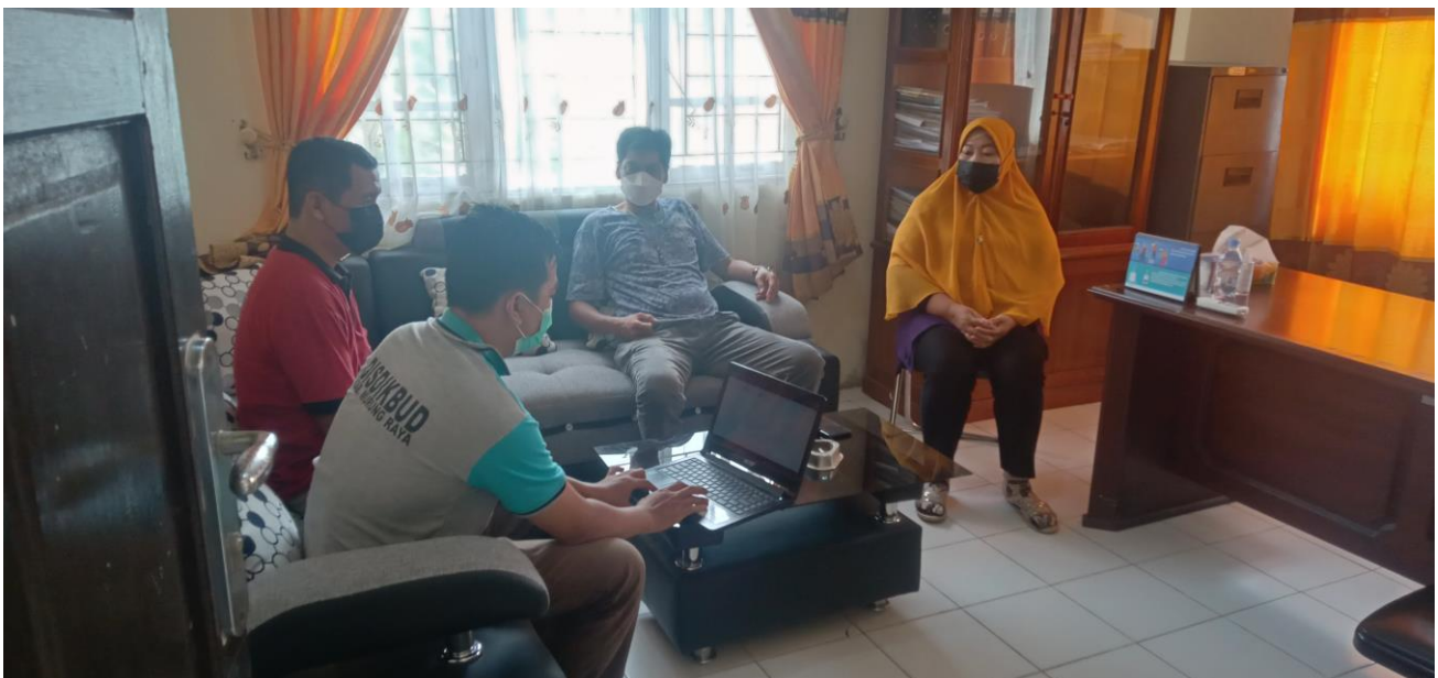
Kegiatan Visitasi ke beberapa Perangkat Daerah